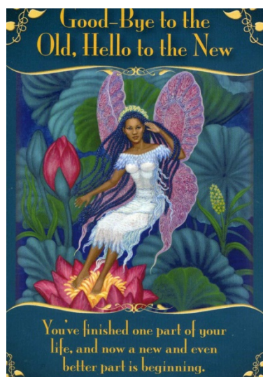
(古いものにさようなら、新しいものにこんにちは)